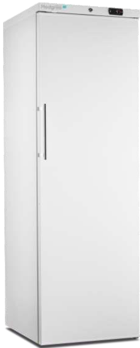
MLRE 450 S