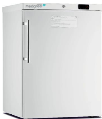
MLF 150 S ATEX