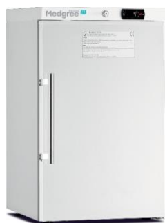
MLF 66 S ATEX