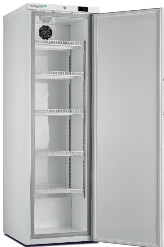
MLF 450 S ATEX